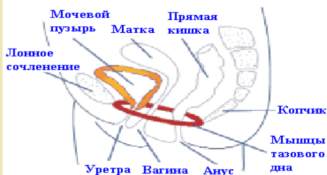
Рисунок 1. Расположение мышц тазового дна у женщин и мужчин